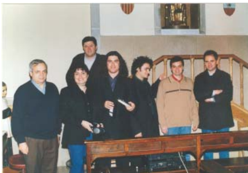
Els mateixos tècnics confraternitzant amb un grup de músics